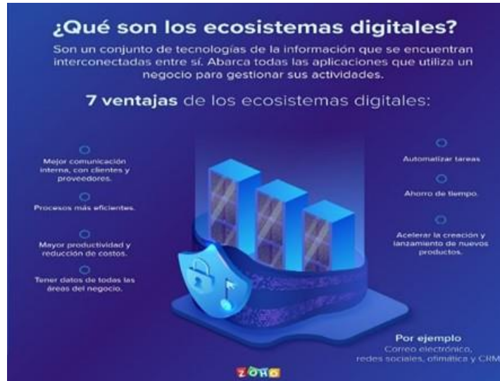
Fig. 2. Potencial de los ecosistemas digitales