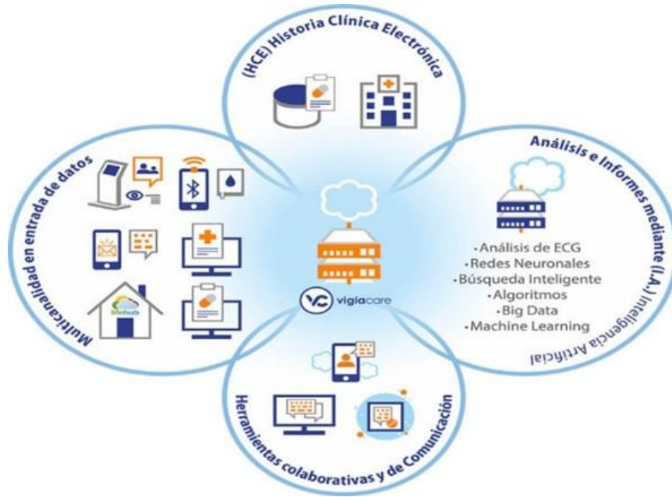
Fig. 3. Entorno Digital. Tomado de [4].

En el sector salud la nueva infiltración de la tecnología y los ecosistemas digitales como ya hemos mencionado han generado una gran cantidad de ventajas, fundamentalmente desde el punto de vista de la atención integral de salud y el trabajo en equipo. Gestión eficiente mediante la eliminación o minimización de las fricciones clásicas de la integración clínico-administrativa.