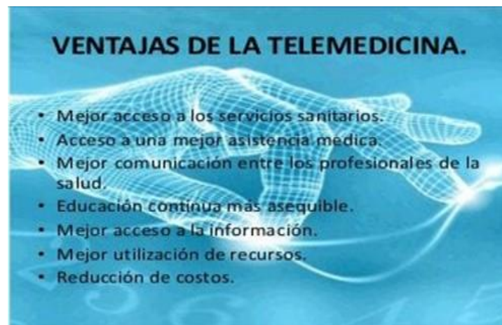
Fig. 5. Ventajas de la Telemedicina.

La Organización Mundial de la Salud luego de la crisis sanitaria mundial producto de la Covid 19 ha potencializado la Telemedicina como una herramienta asistencial importante para los servicios de salud. Siendo varias sus ventajas como puede verse en la Fig. 5.