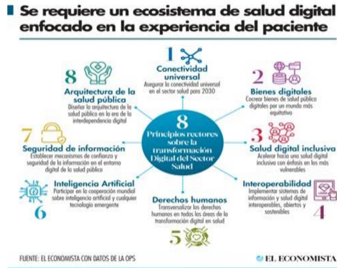
Fig. 4. Principios Sobre la Transformación.